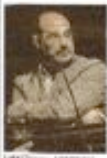
Luca Cordero di Montezemolo