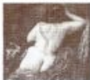
Un'opera di Earl Frank Witkin, è un'opera di Earl Frank Witkin, è un'opera di Earl Frank Witkin.

Witkin è un fotografo americano che ha fatto il disfacimento dei corpi al Pan per una grande personale. Witkin è un fotografo americano che ha fatto il disfacimento dei corpi al Pan per una grande personale.