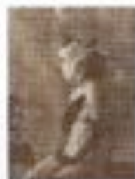
Un'opera di Earl Frank Witkin, è un'opera di Earl Frank Witkin, è un'opera di Earl Frank Witkin.

Witkin è un fotografo americano che ha fatto il disfacimento dei corpi al Pan per una grande personale. Witkin è un fotografo americano che ha fatto il disfacimento dei corpi al Pan per una grande personale.