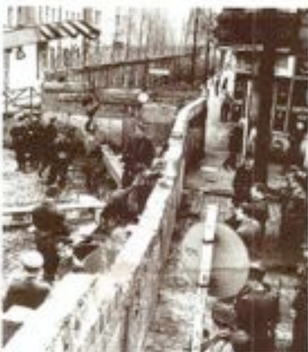
La rassegna «Muro, Sole e Cultura»

C ome sempre con un sorriso, Ken Follett, autore di bestseller, racconta di un'esperienza che ha vissuto nel 2009 a Positano, quando con la sua banda suonò il blues. Follett è un musicista di fama internazionale, ha scritto più di 20 romanzi, tra cui il più recente, Il sopravvissuto , pubblicato da Garzanti. È un uomo di 65 anni, alto, magro, con i capelli grigi, che indossa una giacca scura e un gilet. Sta parlando con noi in un'aula del teatro di Positano, dove si sta preparando per il concerto che inaugurerà il festival di Positano il 27 giugno. Follett è un uomo di 65 anni, alto, magro, con i capelli grigi, che indossa una giacca scura e un gilet. Sta parlando con noi in un'aula del teatro di Positano, dove si sta preparando per il concerto che inaugurerà il festival di Positano il 27 giugno.